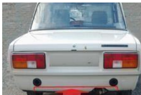
Рис № 6

обивок, серийных ремней безопасности, проводки, серийных сидений, ручного тормоза. Стеклоподъемники разрешено демонтировать при условии фиксации стекол. Шумоизоляционные и антикоррозионные материалы необходимо удалить. Неиспользованные дополнительные кронштейны (на пример для запасного колеса и т.д.), которые находятся на шасси/кузове можно демонтировать. Допускается отрезать нижнюю часть задней панели кузова (юбку), от нижней кромки до пола багажного отделения, между проемами кронштейнов крепления заднего бампера (Рис №6).