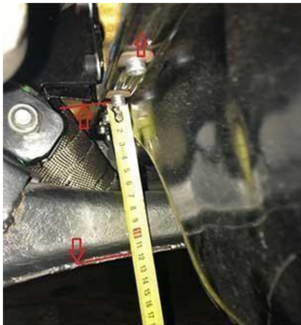
Рис № 3

Допускается дополнительно одно крепление.