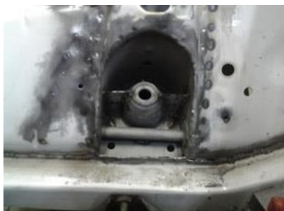
Рис № 4

Амортизаторы - СВОБОДНЫЕ. Количество амортизаторов – серийное. Использование амортизаторов с выносными бачками и или регулировками усилия запрещено. Диаметр элементов крепления амортизаторов к нижнему рычагу может быть увеличен до 10 мм. Можно усилить верхнее крепление амортизатора, сохраняя серийное место крепления ( Рис № 4). Элемент нижнего крепления переднего амортизатора - СВОБОДНЫЙ, при условии серийного места крепления к нижнему рычагу. Допускается пропускать крепёжные болты стабилизатора и (балки) передней подвески через лонжероны, не меняя места серийных точек крепления.